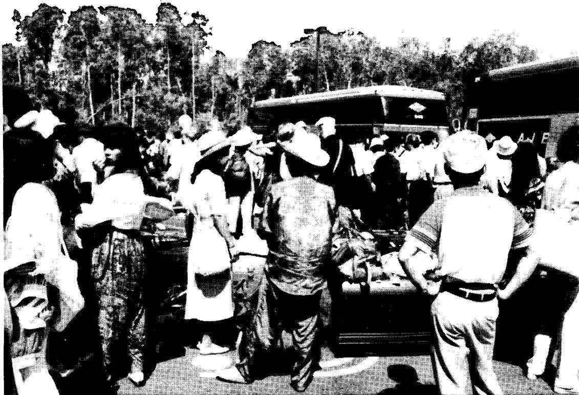
* Bạn đạo chờ xe chuẩn bị xuống tàu