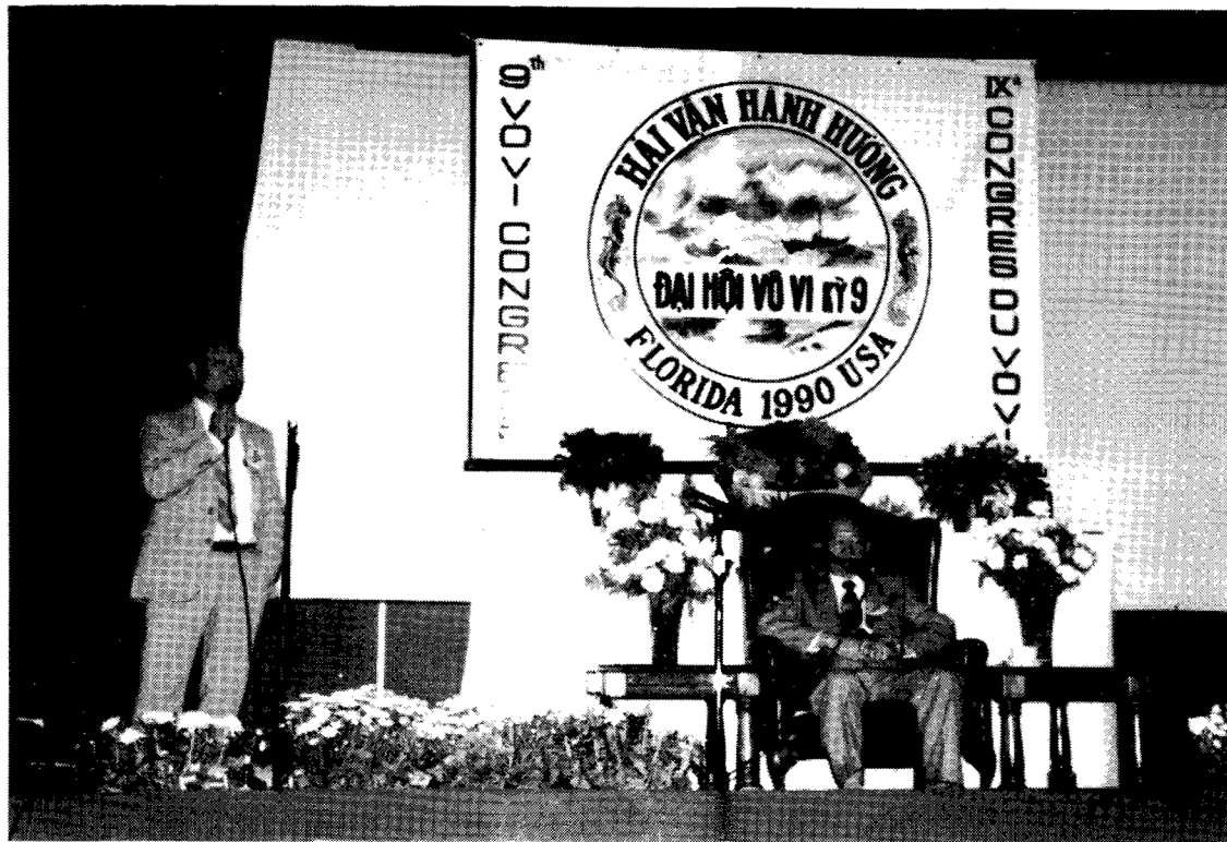
* Anh Trưởng Ban Tổ Chức ĐHHVHH phát biểu cảm tưởng trong Đại Hội kỳ 9