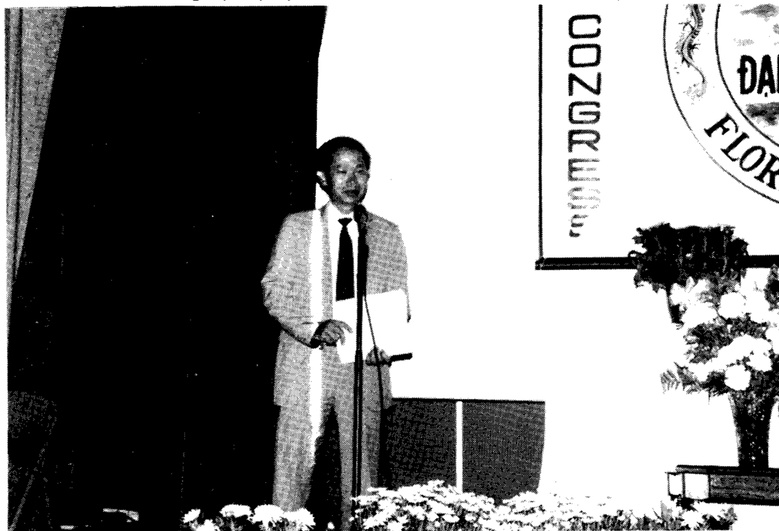
* Anh Hội Trưởng Hội AHVVHK đang phát biểu cảm tưởng