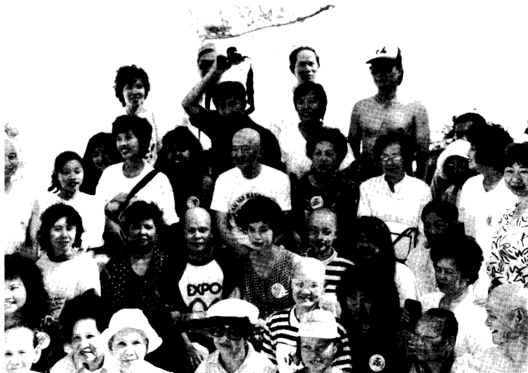
* Ông Tám và bạn đạo chụp hình lưu niệm