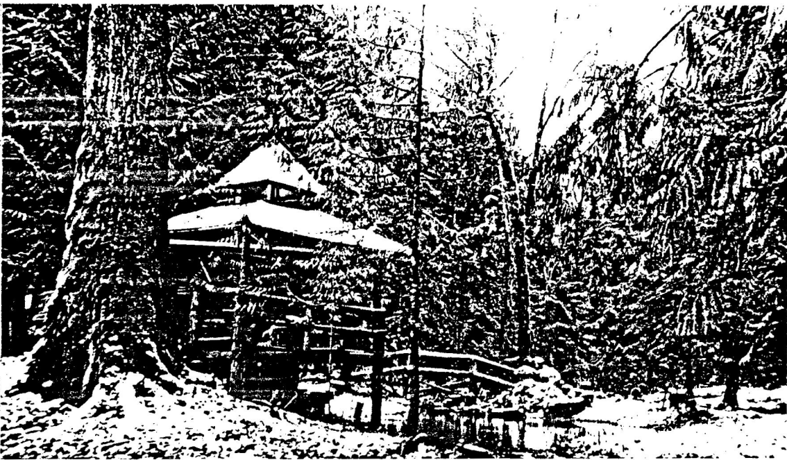
Thiền viện Nhân Hòa là cơ sở tâm linh của Bạn Đạo khắp năm châu.

VOVI FRIENDSHIP ASSOCIATION IN WASHINGTON 4104 Goldsby street South West Olympia, Washington 98502 Tel (206) 357-5675