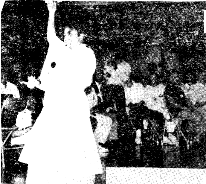
Vũ khúc của Hà Tiên Cô qua Nam Mai