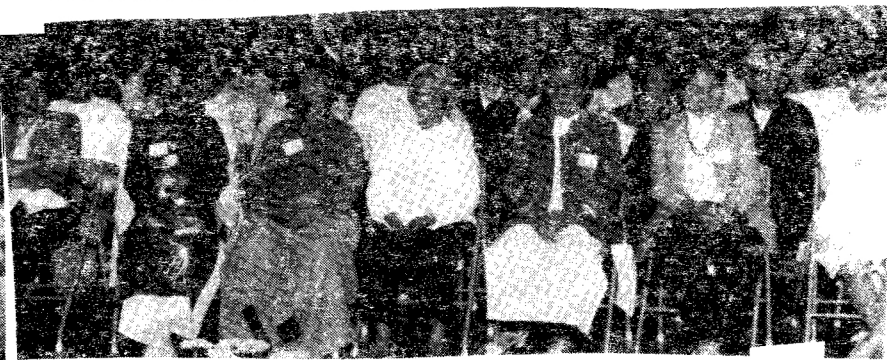
Tại hội trường