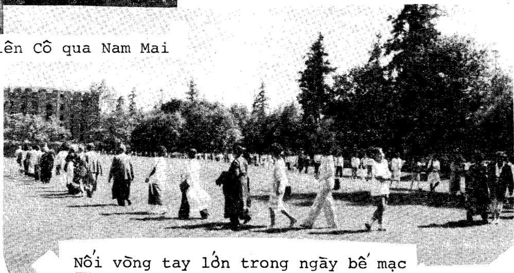
Nổi vông tay lớn trong ngày bế mạc